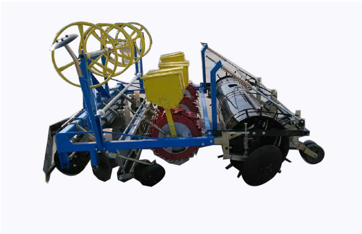
2MBJ-1/6 型机械式精量铺膜播种机