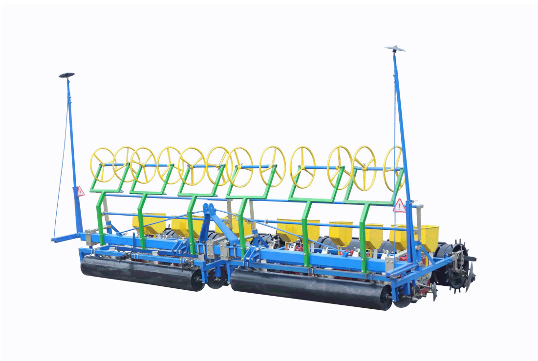
2MBJ-2/12 型机械式精量铺膜播种机